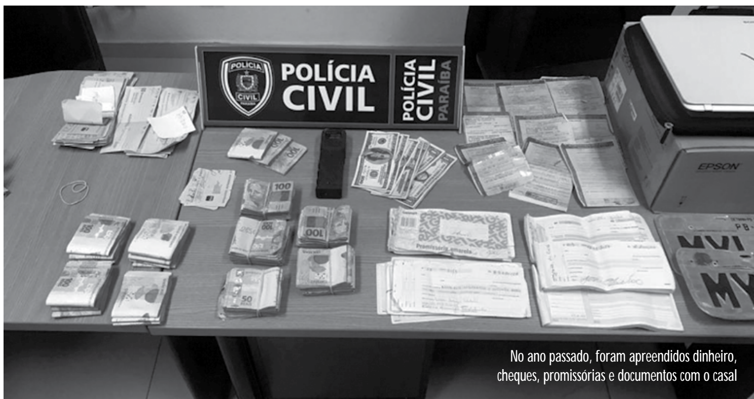
No ano passado, foram apreendidos dinheiro, cheques, promissórias e documentos com o casal