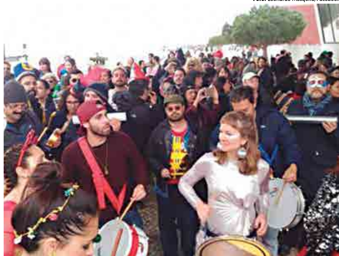
Bloco Bué Tolo, inspirado no Boi Tolo, que arrasta multidões no Rio de Janeiro, agita as ruas de Lisboa

Portugal é um país que também vive a tradição do carnaval. Em alguns locais, como na Ilha da Madeira ou em cidades como Torres Vedras e Loures, há desfiles