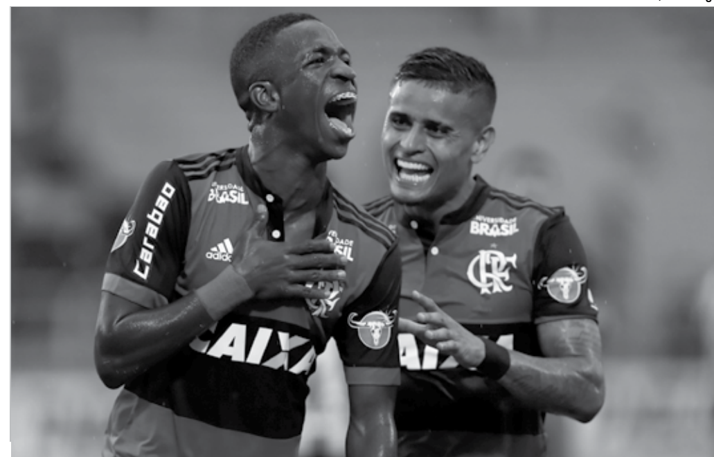
O atacante Vinicius Junior (E) marcou um belo gol contra o Botafogo na vitória de 3 a 1 no último sábado