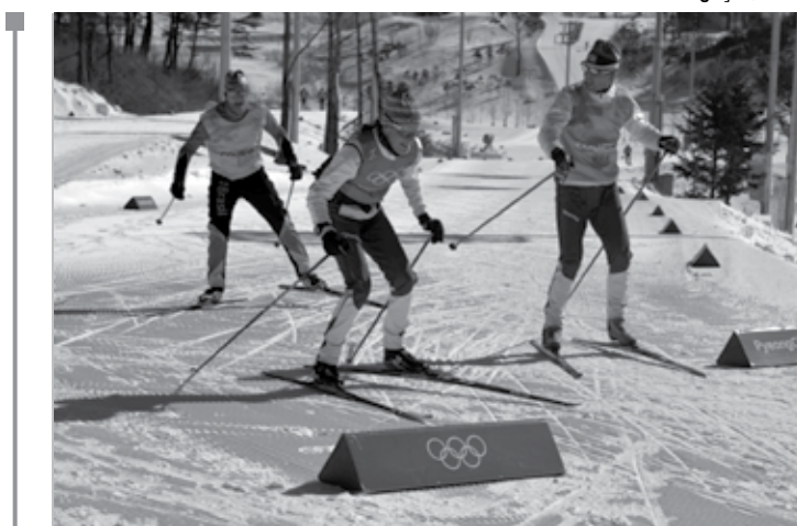
Atletas brasileiros do esqui cross country treinando para a estreia