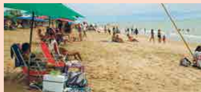
O tempo nublado e chuvoso não afastou o banhista das praias de JP