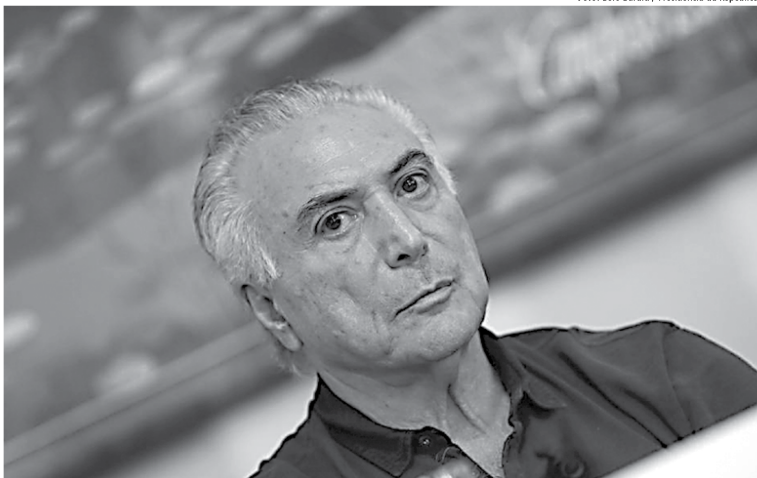
Temer suspende folga de Carnaval e viaja a Roraima, onde anunciou a força-tarefa; presidente foi alvo de protestos na capital do Estado, Boa Vista

Em sua fala, o ministro do GSI fez críticas indiretas ao governo venezuelano e aos governos anteriores do Brasil que apoiaram a atuação dos governos Nicolás Maduro e Hugo Chávez. Ao citar os problemas na Venezuela, que acabaram por resultar neste fuga em massa para o Brasil, o ministro Etchegoyen citou que "este êxodo social foi provocado por decisões ideológicas, que levaram ao desastre venezuelano", lem-