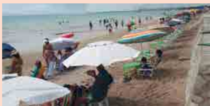
Alugar uma cadeira e guarda sol está custando entre R$ 25 a R$ 30